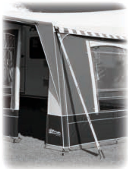
Set Cinchas UNI UNI Storm straps